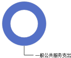
一般公共预算当年拨款结构图

2023年度一般公共预算当年拨款2,618.06万元，主要用于以下方面：一般公共服务支出2,618.06万元，占100.00%。